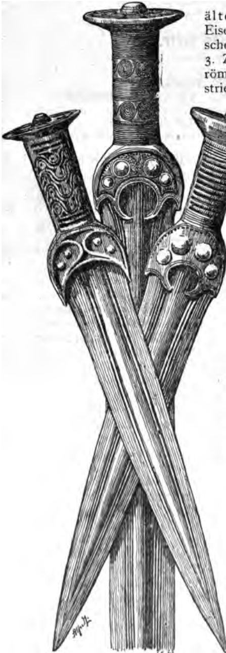
I Band. Abl. 167. Schwert und Dolche aus der ältesten Bronzezeit.

stimmung und Funde. 12. Gräber und Grabbeigaben. 13. Feld- und Moor- funde etc. 14. Innere Zustände, Handwerk und Ackerbau, Kunst und Religion.